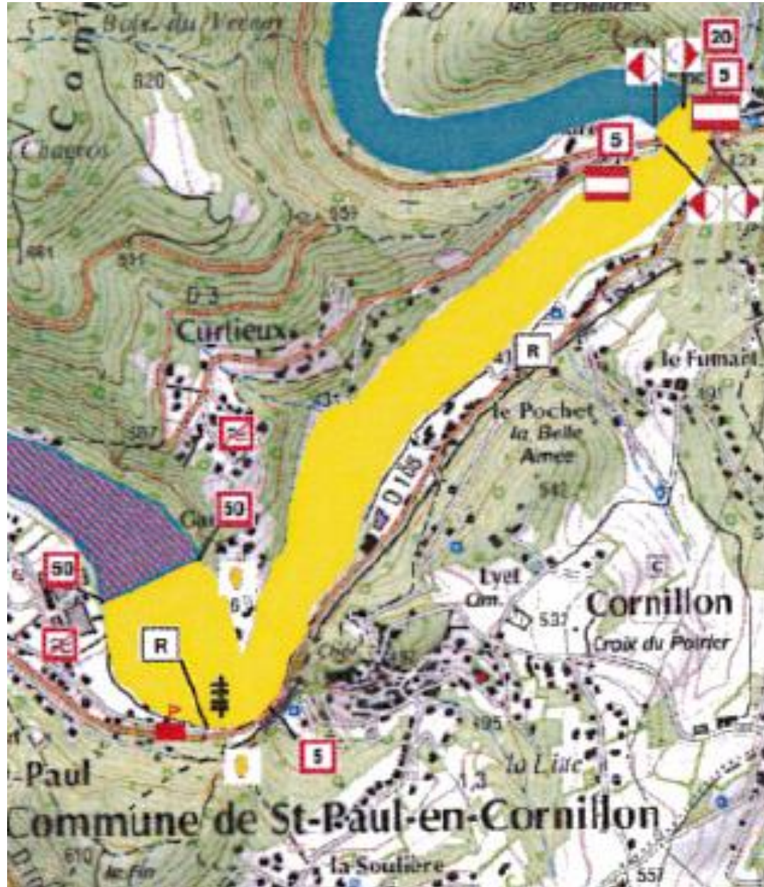
Zone dite de la Vigie Mouette selon l'arrêté Interpréfectoral de septembre 2014