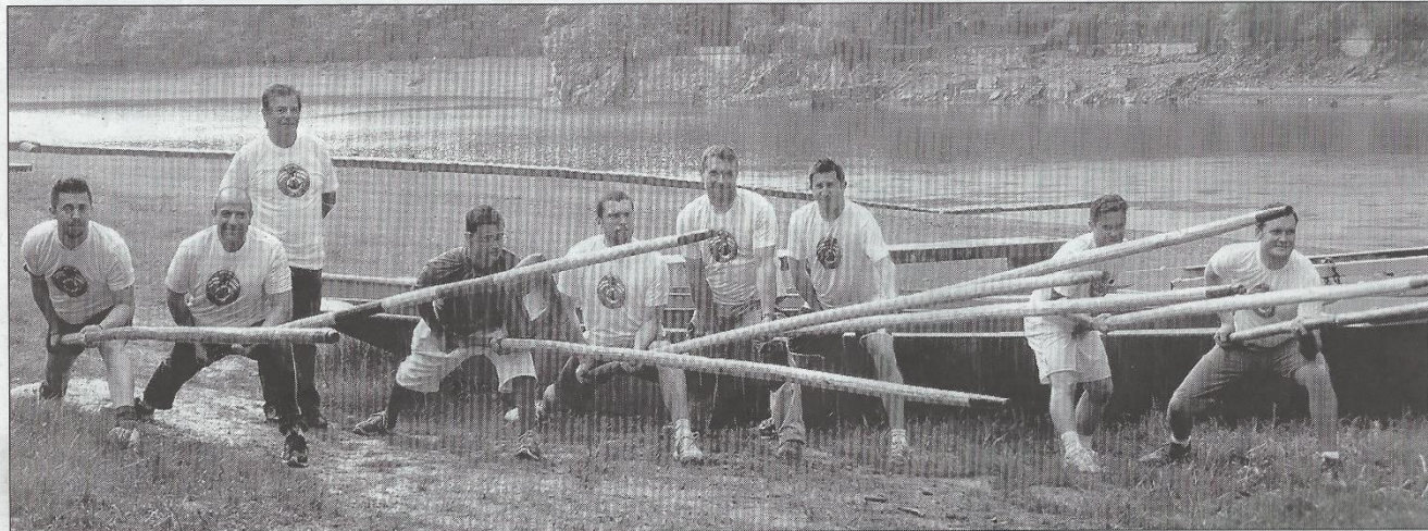
Les jouteurs de la Vigie-Mouette en plein entraînement sur le site du Pertuiset.